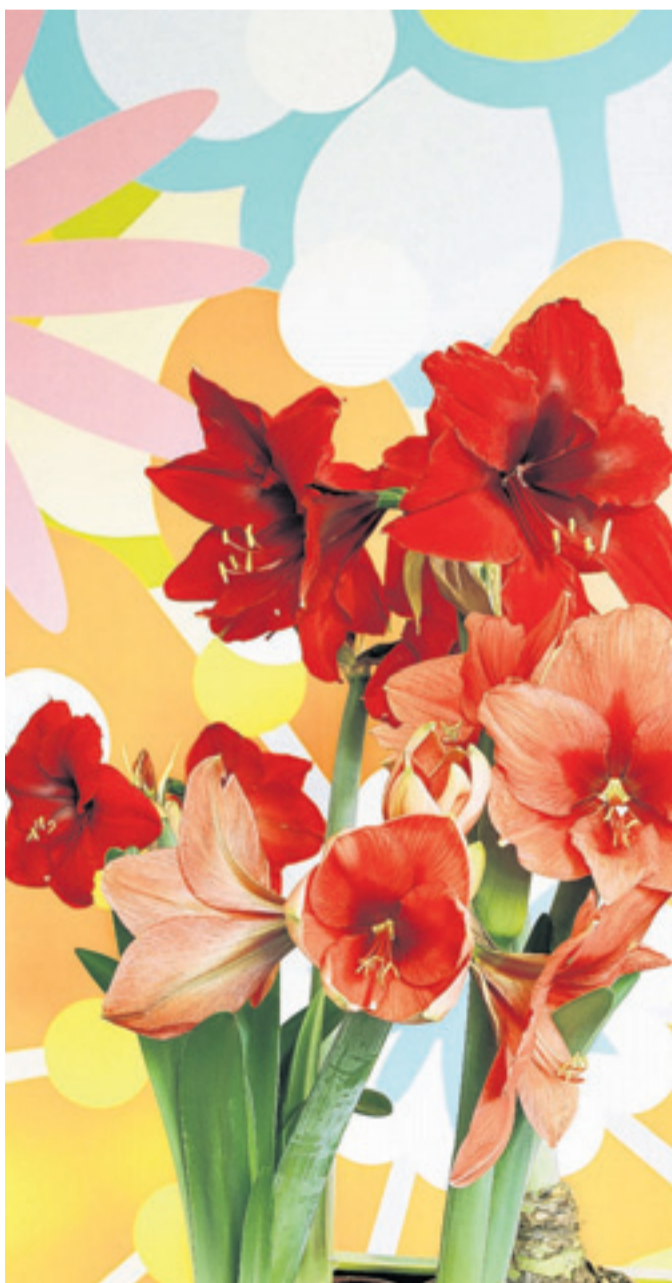
Warum nicht mal Biologieunterricht auf dem Fensterbrett?

Bunte Pflanzen fürs Kinderzimmer kommen bei Kids gut an