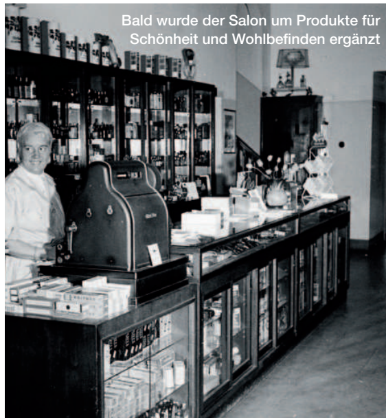
Bald wurde der Salon um Produkte für Schönheit und Wohlbefinden ergänzt