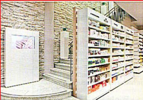
Stufen zum "Himmel": Entspannen im Trubel der Stadt.

Parfümerie Mußler Stuttgart: Anfang April luden die Parfümerie Mußler und Dr. Hauschka Kosmetik zur Eröffnung der neu gestalteten Beauty Lounge der Parfümerie Mußler nach Stuttgart in die Hirschstraße ein. Für die Beauty Lounge hat Dr. Hauschka Kosmetik ein neues Kabinenkonzept entwickelt, das bei Mußler erstmals realisiert wurde. Natürliche, langlebige Materialien (aus natürlichen Rohstoffen oder Recyclingmasse gewonnen) gehen mit modernem Design eine harmonische Verbindung ein und schaffen gleichzeitig eine elegante Atmosphäre. Wer diese Treppe hochsteigt, entflieht dem Trubel der Stadt. Denn oben ist Entspannung und natürliche Schönheitspflege angesagt. Verwöhnen lassen kann man sich von einer speziell ausgebildeten Dr. Hauschka Naturkosmetikerin, die die klassische Dr. Hauschka Kosmetikbehandlung sowie Varianten davon anbietet, wie Reinigungsbehandlung, Revitalisierungs- oder Entspannungsbehandlung.